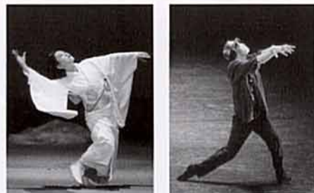
video photo saito