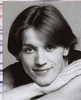
デニス・マトヴィエンコ