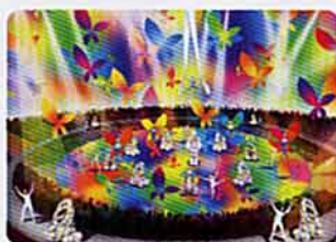
メインショー演出イメージ

人も地球ももっとすばらしくなる。 モビリティが拓く、人と地球のよりよいつながり。