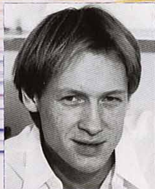
イーゴリ・ゼレンスキー