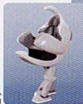
橋本歩行型ロボット 「i-foot」