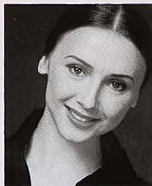
スヴェトラナ・ザハーロフ